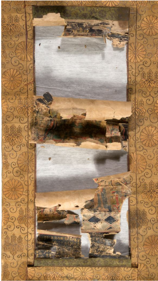
Zustand vor Restaurierung